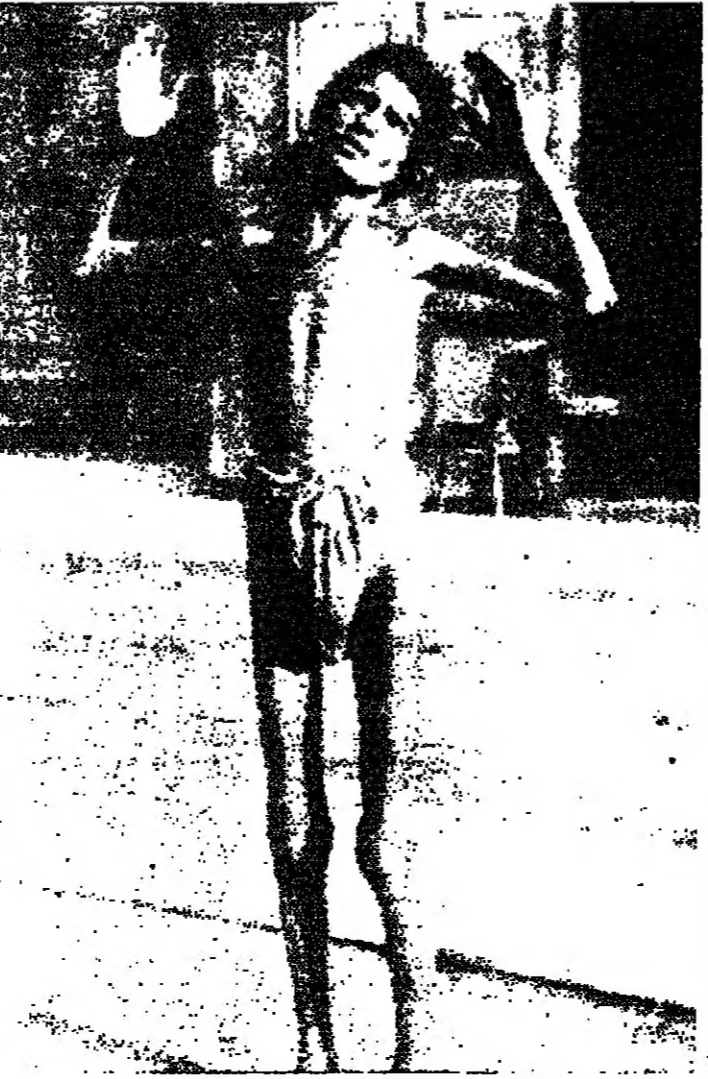
تضرع الى السماء